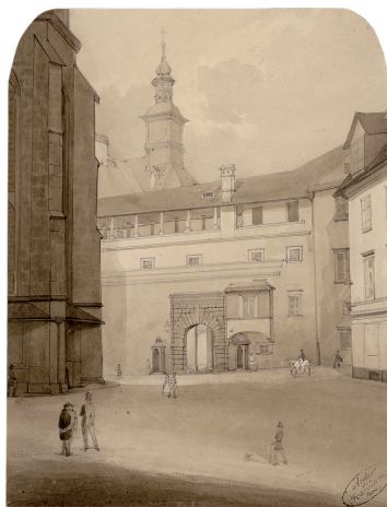
Abb. 03-1 Gustav Prückner, Graz GRAZ, BLICK VON DER BURGGASSE AUF DIE EINGANGSFREONT DER BURG MIT DEM TROMPETERGANG UND DEM UHRTURM DES PALAS, NOVEMBER/DEZEMBER 1853 Salzpapier, 24 x 19,2 cm (Karton 29,3 x 23,1 cm); im Bild rechts unten Stempel „Archiv des Joanneums Graz“ (angeschnitten). Blatt aus einer neun Motive umfassenden Fotoserie, die vor und während der in den Jahren 1854/55 erfolgten Demolierung von Gebäudeteilen der Grazer Burg und des Verbindungsganges zum Dom entstanden ist. StLA, OBS Graz II F-2-A-2-4