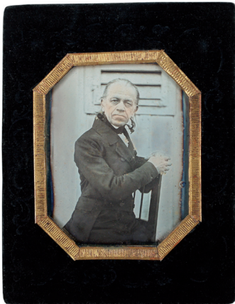
Abb. 01 Anonym JOSEF WARTINGER, UM 1845 Daguerreotypie, koloriert, 7,5 x 5,7 cm (Bild), 12,6 x 9,7 cm (Montierung Samt). StLA, PS allgemein, Wartinger Josef