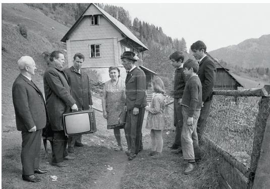
Abb. 20 „KREISKY-SCHLAGER, FERNSEHGERÄTÜBERGABE FRAUENBURG, 26. OKTOBER 1969“ (BEZ. AUF FILMHÜLLE) Nach einem Kleinbildnegativ, 24 x 36 mm.