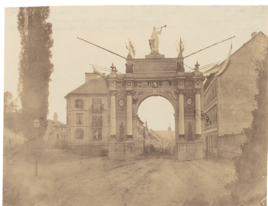
Abb. 05 GRAZ, TRIUMPHBOGEN IN DER ANNENSTRASSE, ERRICHTET FÜR DEN BESUCH VON KAISER FRANZ JOSEPH I. UND KAISERIN ELISABETH IN GRAZ, SEPTEMBER 1856 Salzpapier, 28,3 x 37,4 cm; nicht kaschiert, verso Stempel „Archiv des Joanneums Graz“ und handschriftlich bez. „Photogr. von Reichert, zum Einzuge Ihrer Majestäten September 56.“ sowie (andere Handschrift) „Beim Beginn der Annenstrasse Graz zur Feier des Einzuges der Kaiserin Elisabeth“ und (andere Handschrift) „Triumphbogen beim Beginn der Annenstrasse zur Feier des Einzuges des Kaiserpaars Sept. 1856“.