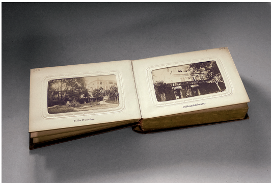
Abb. 08 S[amuel] Volkmann, Graz FOTOALBUM „GLEICHENBERG“, AUFGESCHLAGENE DOPPELSEITE MIT „VILLA TRIESTINA“ (LINKS) UND „VILLA WEIHNACHTSBAUM“ (RECHTS), 1868–1870 Handschriftliche Widmung auf dem Schmutztitel: „Gleichenberg und seine Umgebung, nach der Natur photographirt von S. Volkmann in Graz und dem Wohlgeborenen Carl Ohmeyer, Director des Gleichenberger Johannisbrunnen Actien-Vereines achtungsvoll gewidmet“; Einsteckalbum mit 36 Fotografien im Visitformat (ca. 6,1 x 10,3 cm Untersatzkarton); Orts- und Gebäudeansichten in Gleichenberg und Umgebung; Albuminpapier, Bildtitel handschriftlich auf den Albumseiten; Einband braunes Leder, Titel „Gleichenberg“ in Goldprägung, Messingschließe, 10,7 x 14 x 4 cm. StLA, OBS Gleichenberg III, Album 1