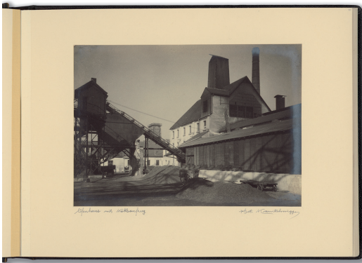
Abb. 17 Maximilian von Karnitschnigg, Graz ALBUM STÄDTISCHES GAS- UND ELEKTRIZITÄTWERK GRAZ, VOR 1933, „OFENHAUS MIT KOKSAUFZUG“ Gelatine-Entwicklungspapier, 16 x 22,5 cm; unter dem Bild handschriftlich bez. (links) und sign. „phot. Kar- nitschnigg“ (rechts); Foto Nr. 4 von 20 Fotografien, jeweils handschriftlich bez. und sign., Abzüge eingeklebt, Hoch- und Querformate, etwa 17 x 23 cm, alle Gelatine-Entwicklungspapier; Album Seite 1 Text bez. „Ihrem Prokuristen, Herrn Bürgermeister Vinzenz Muchitsch, der als erster Volksbürgermeister der Landeshauptstadt Graz die Übernahme des Gas- und Elektrizitätswerkes in den Besitz der Gemeinde und den Ausbau dieses Werkes durchführte, von Direktion, Angestellten und Arbeitern Graz in dankbarer Wertschätzung zur Vollendung des 60. Lebensjahres gewidmet. Graz, im Februar 1933“; Album Einband grünes, strukturiertes Papier, Grazer Stadtwappen in Weißprägung, Kordelbindung, 25,8 x 36 cm. StLA, Muchitsch Vinzenz, Nachlass, K 1, H 6, S. 5