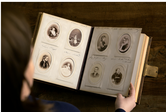
Abb. 09 Verschiedene Fotografen, Graz, Wien und andere SAMMELALBUM DER FAMILIE DER FREIHERREN VON KULMER, GRAZ, UM 1860 BIS 1880 Einsteckalbum mit 97 Fotografien im Visitformat; albuminiertes Salzpapier, Albuminpapier; z. T. fotografische Reproduktionen, z. T. Atelieraufnahmen; Einzel- und Gruppenporträts von berühmten Persönlichkeiten, MusikerInnen, LiteratInnen, SchriftstellerInnen, bildenden und darstellenden KünstlerInnen; Fotos eingeschoben in vorgefertigte Fenster; großteils handschriftlich bez. auf den Albumseiten; Einband grüner Karton mit Prägung, Messingbeschläge und -schließe; 27,8 x 21 x 3,5 cm (geschlossen). Aufgeschlagene Doppel-Seite: v. li. o. n. r. u.: Porträts von Rossini, Bellini, Donizetti, Verdi, Chopin, Mendelssohn, Wilhelmine von Müllenaу (Gruppe), Clara Schumann (alle bez.), Albuminpapier. StLA, Kulmer, Familie K 1, H 6