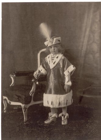
Abb. 15 Adolf Szenes, Budapest KRONPRINZ FRANZ JOSEPH OTTO ANLÄSSLICH DER KRÖNUNG SEINER ELTERN KAISER KARL I. UND KAISERIN ZITA ZUM KÖNIG BZW. ZUR KÖNIGIN VON UNGARN, BUDAPEST, 30. DEZEMBER 1916 Mattes Kollodiumpapier, gold- und platingetont, nicht kaschiert, 22 x 15,8 cm; im Bild rechts unten Prägestempel „Szenes Koller utóda, Budapest; Törv. Vedve 1917“. StLA, PS Habsburger, Kronprinz Otto, 3